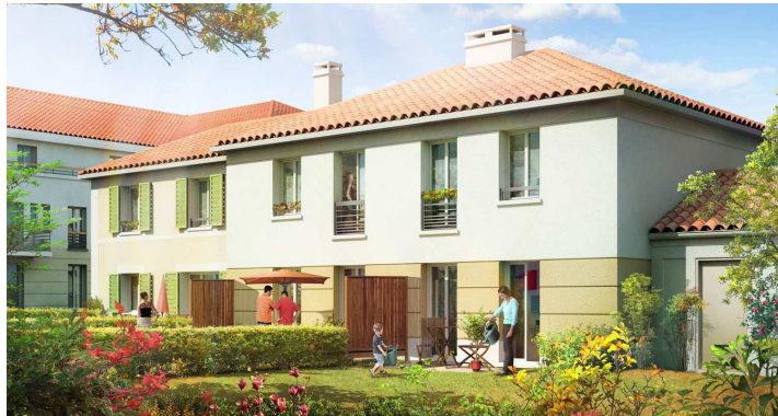
Maisons de ville 3 chambres