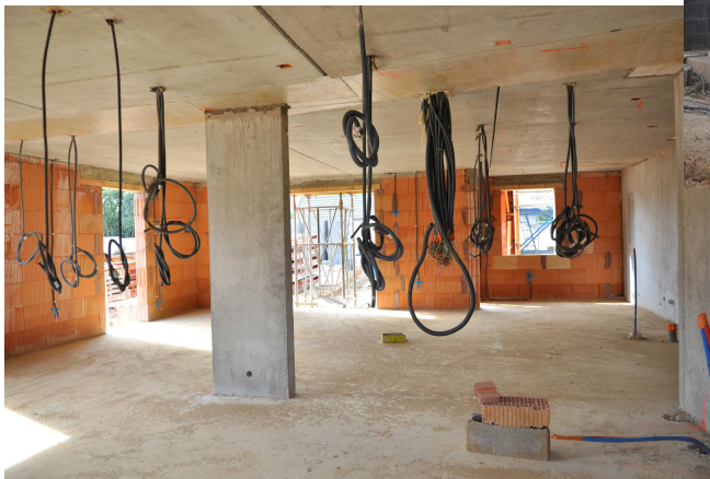
Inauguration le lundi 2 avril 2012