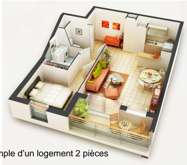
Exemple d'un logement 2 pièces