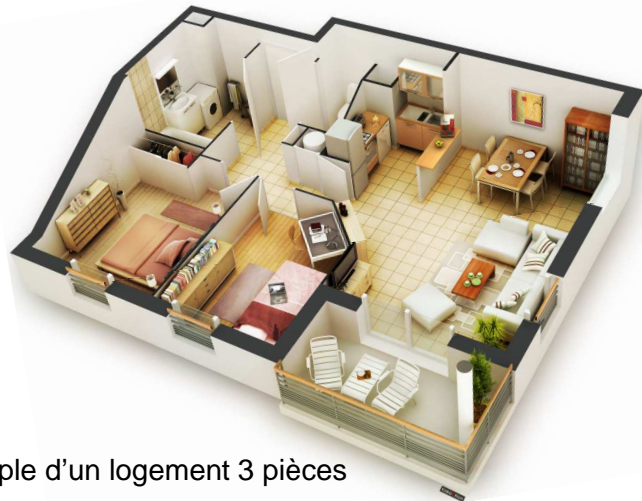
Exemple d'un logement 3 pièces

Les 3 bâtiments à l'architecture contemporaine, proposent des appartements fonctionnels du 2 au 5 pièces, avec place(s) de parking.